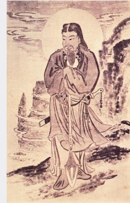
国祖 国常立尊 (出口王仁三郎筆)

皆々様が大神様の廣大無辺なるご神徳によりて 清々しく平安なる一年をお過ごしになりますよう 謹んでお祈り申し上げます。