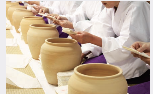
瀬織津姫が奉仕する人型大祓神事

皆々様が大神様の廣大無辺なるご神徳によりて 清々しく平安なる一年をお過ごしになりますよう 謹んでお祈り申し上げます。