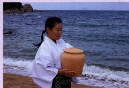
人型・型代を納めた素焼きの壺を持つ瀬織津姫

皆々様が大神様の広大無辺なるご神徳によりて、清々しく平安なる一年をお過ごしになられますよう謹んでお祈り申し上げます。